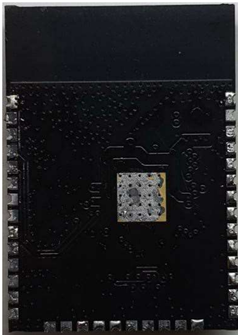
ESP32M16_Main Board 후면